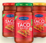
Taco sósur 3 teg 230g Tilboðsverð